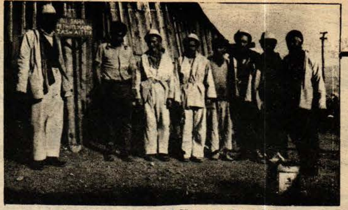
Kayseri Pınarbaşı Karahacılı maden ocağında çalışan bir grup işçi

Karahacılı maden ocağı, Kayseri-Pınarbaşı yolu üzerinde Zamantı suyunun kenarındaki Bahçecik durağına yarım saat çeker.